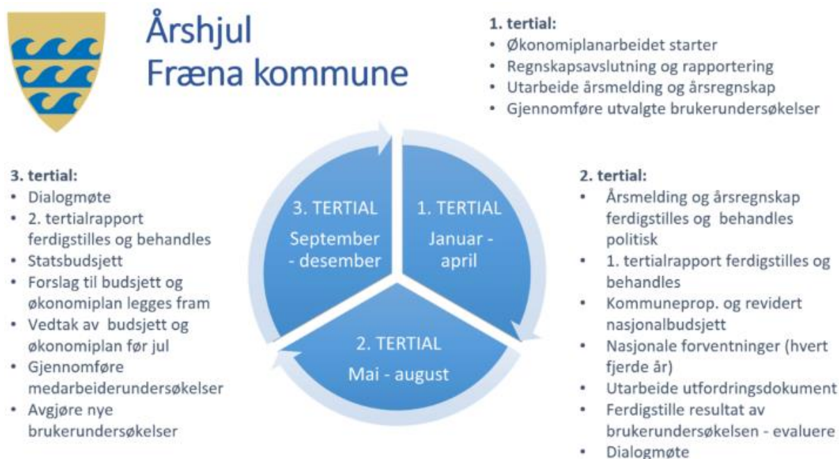
Figur: Årshjul for Fræna kommune

Rapportering skjer i henhold til årshjul for Fræna kommune.